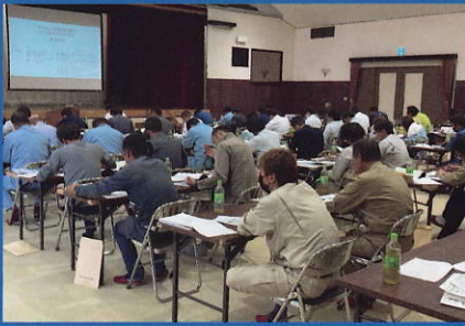
▲河川環境技術者講習の様子