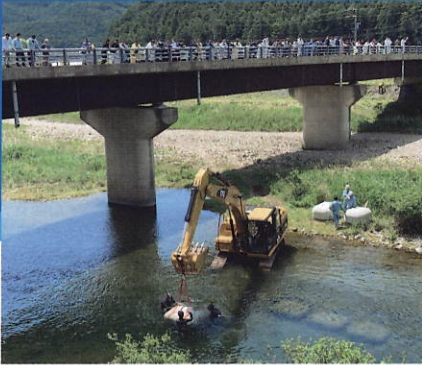
▲アユストーン投入を見学

私たちは、河川環境の維持と安全性の両立を目指し、国土交通省が提唱している「多自然川づくり」を実現するための取り組みを進めています。その一つが、河川工事を実施する際に、工事地域周辺の水生生物の調査および捕獲生物を移動させる「魚族の保護」です。工事の影響を受ける全ての生物を救えるわけではありませんが、現地に生息している生物を確認・計数して再放流し、工事関係者と情報を共有することで、生物生態の面から河川環境に対する造詣を深めていただいています。